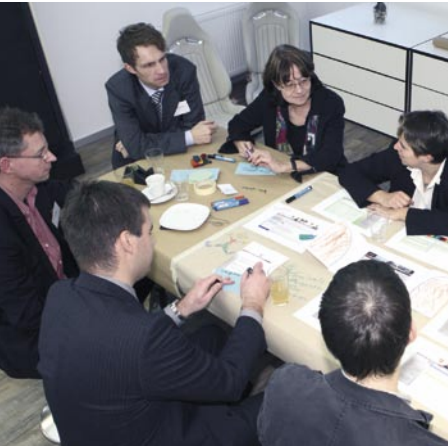
World-Café bei Wissen live!